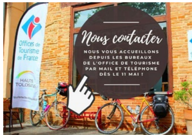
Office de Tourisme des Hauts Tolosans 05 61 82 93 85 - tourisme@hautstolosans.fr

Une ouverture au public est envisagée vers la mi-Juin (si les conditions sanitaires le permettent).