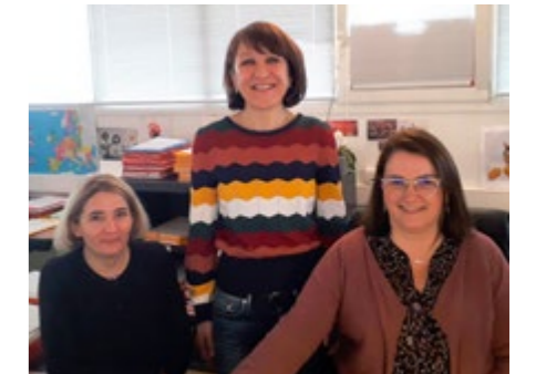
Service urbanisme de la communauté de communes des Hauts Tolosans

L'accueil physique sera organisé exclusivement sur rendez-vous.