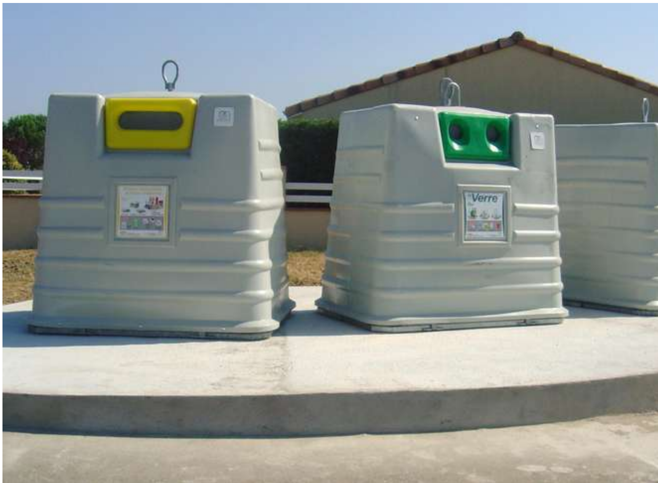
colonnes d'apport volontaire aériennes

Nous vous demandons donc de ne plus présenter vos bacs individuels à couvercle jaune, et d'éviter au maximum de remplir les bacs de regroupement.